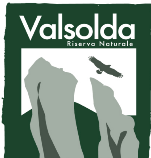
Tavola 4.1 B